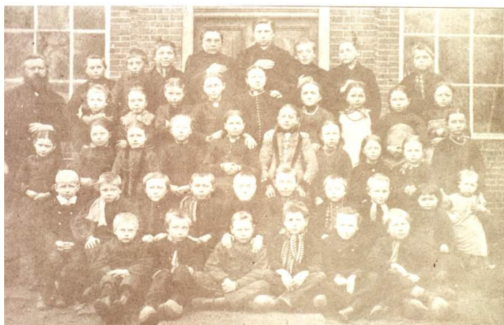
Leerlingen en personeel rond 1890 van de Openbare Lagere School Noordlaren