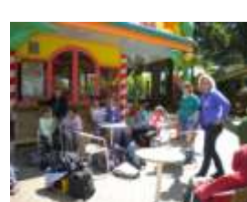
Groep 5&6 in Hellendoorn!