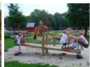
Groep 1&2 in Nienoord!